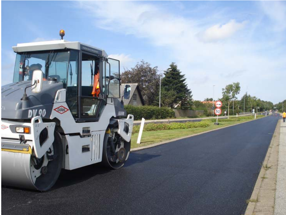
Udlægning af Climafalt i Vestbjerg..