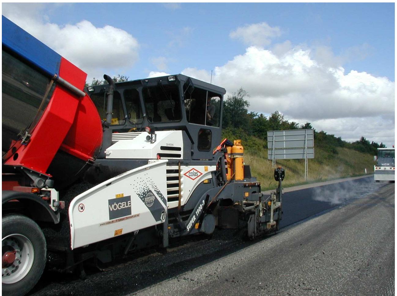
Billede 1. Udlægning af 2,5km HM-Asfalt bindelag i det tunge spor på M70.

Såvel ved nyanlæg som ved forstærkningsopgaver vil anvendelsen være en seriøs mulighed.